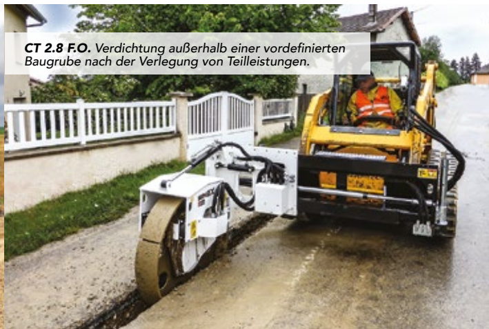
CT 2.8 F.O. Verdichtung außerhalb einer vordefinierten Baugrube nach der Verlegung von Teilleistungen.